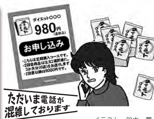
イラスト 鈴木 薫

インターネットや SNS で「初回特別価格 980 円！」と記載されている広告を見て、ダイエットサプリを1回だけのお試しのつもりで申し込んだ。しかし2週間後、6袋(3か月分)のサプリメントが届き、確認をすると定期購入のコースに申し込んでいたことが分かった。あわてて業者に電話し、解約しようとしたが、何回電話しても電話が繋がらない。このまま、購入し続けなければならないのだろうか。