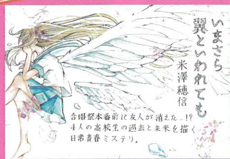
(優秀賞・高校生の部)