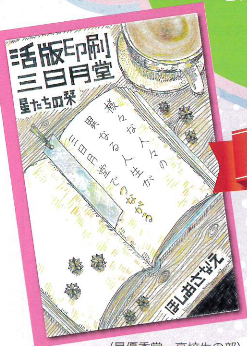
(最優秀賞・高校生の部)