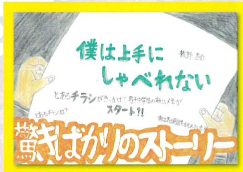
(優秀賞・中学生の部)