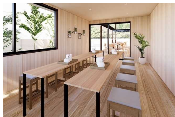
ワークショップスペースイメージ図