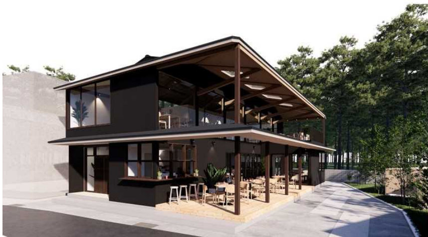
『天風 TERRACE』完成イメージ図