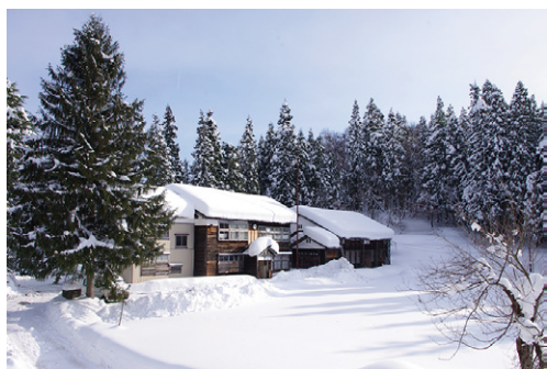
ミティラー美術館 (新潟県十日町市)

本展覧会ではミティラー美術館の協力を得て、同館のコレクションから約50点を紹介します。コスモロジーあふれるインド美術の魅力に触れていただくことで、和歌山県とインドの友好を深める機会としたいと思います。