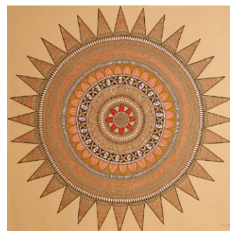
3. ゴーダーワリー・ダッタ 《チャクラ》1990年