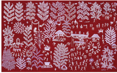
5. ジヴヤ・ソーマ・マーシェ 《村の結婚式》1994年