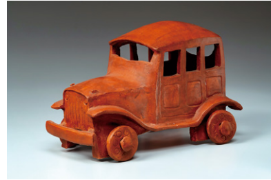
8. ララ・バンディット 《自動車》2005年