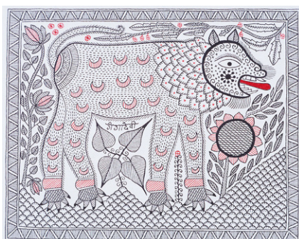
2. ガンガー・デーヴィー 《上弦の月を喰べる獅子》1990年