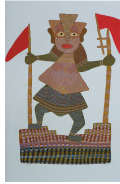
7. ジャンガル・シン・シュヤム 《チャーンドイー女神》1999年