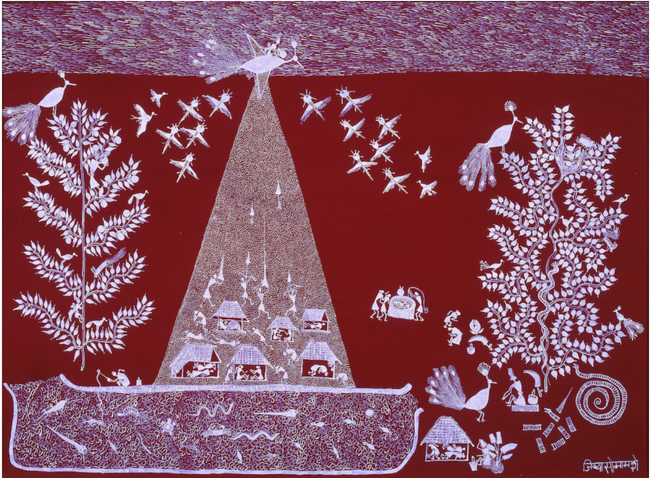
1. ジョヴァ・ソーマ・マーシェ 《パールから生まれた娘》1996年