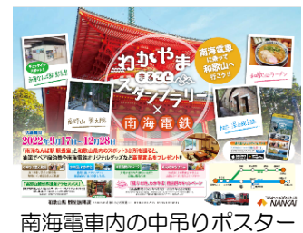
南海電車内の中吊りポスター