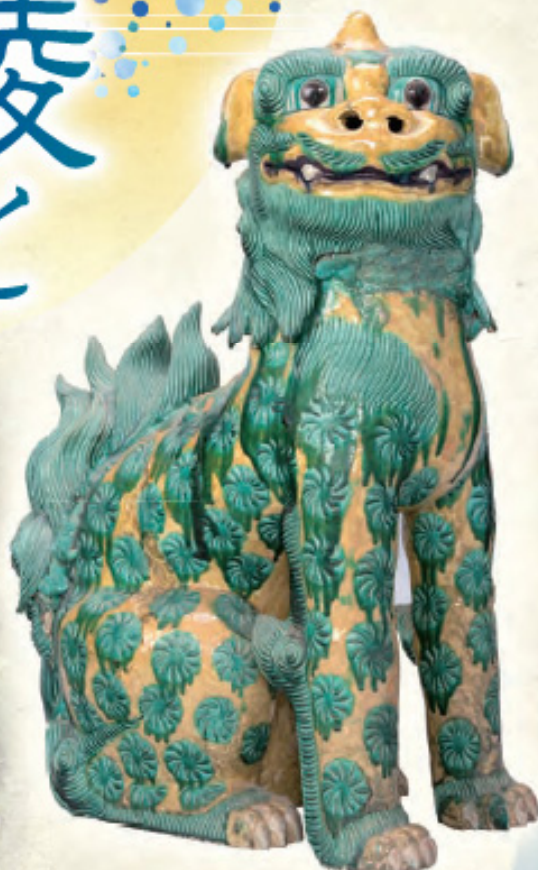
和歌山県指定文化財 南紀男山焼 三彩狛犬 廣八幡宮蔵