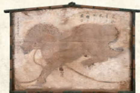
絵馬「馬之絵」徳川頼宣奉納 廣八幡宮蔵