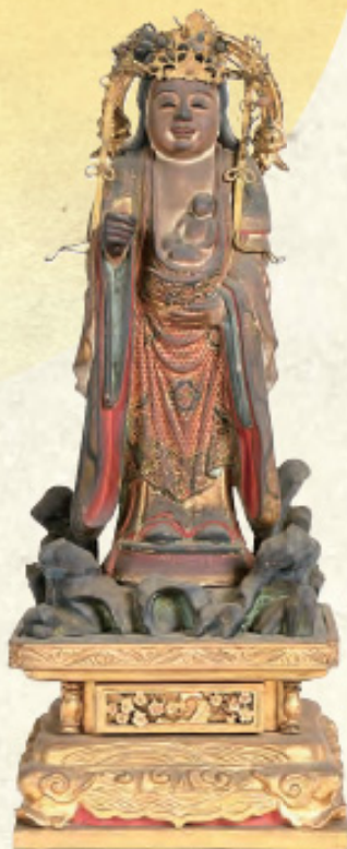
鬼子母神立像 養源寺蔵