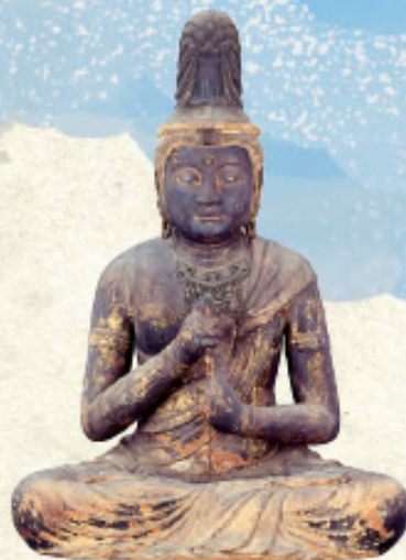
大日如来坐像 四天王寺蔵