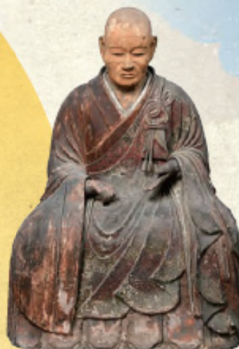
一空上人坐像 法蔵寺蔵

本展では、梧陵ゆかりの資料を紹介するとともに、幾度の地震津波に遭遇しながら、今日まで守り続けられてきた広村周辺に所在する廣八幡宮・明王院をはじめ、法蔵寺・養源寺・安楽寺に残る文化財を紹介します。