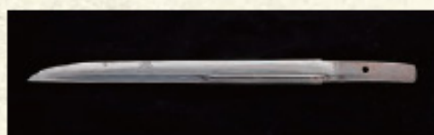
重要文化財 短刀 銘来国光 廣八幡宮蔵