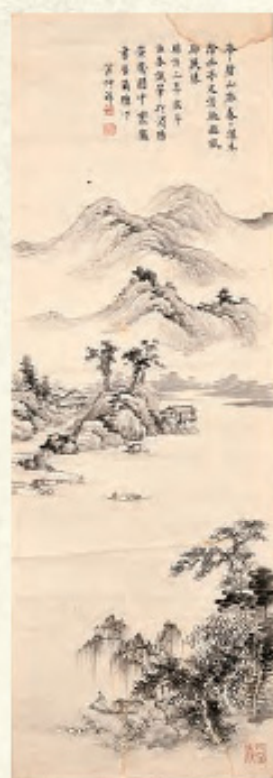
山水図 黄仲祥筆 安楽寺蔵