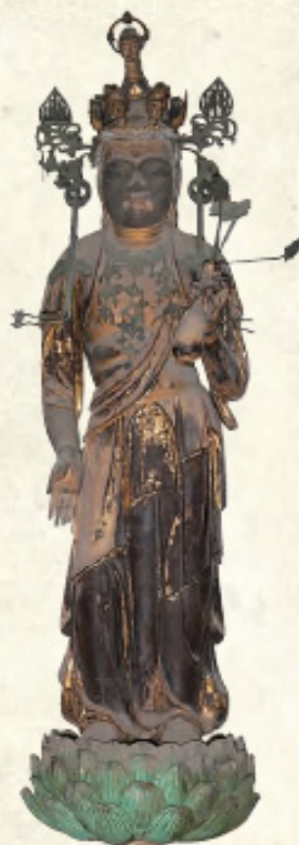
十一面観音立像 明王院蔵