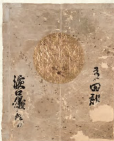
背旗「有田郡 濱口儀兵衛」稲むらの火の館蔵