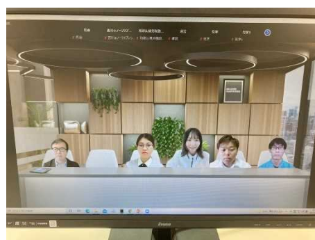
パネルディスカッションの様子（内容④）