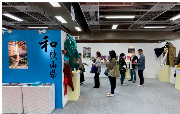
第103回東京レザーフェアの様子(R4.5.26～27)