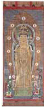
本尊十一面観世音菩薩御影大画軸(複製)