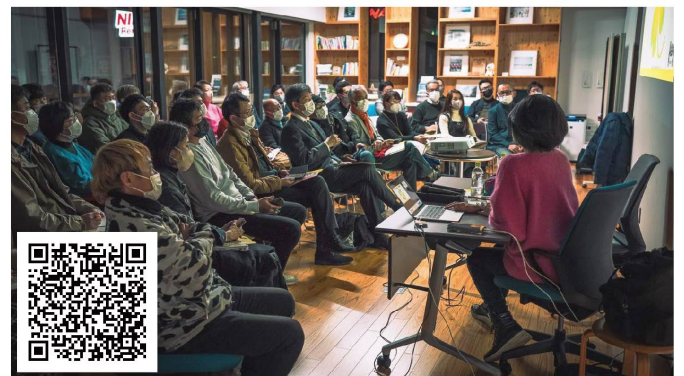
#ウェルビーイングセミナー @白浜町・すさみ町 2/2 (木)・2/14 (火)・2/17 (金)・2/18 (土)・2/19 (日)