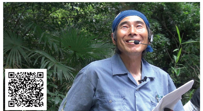
#『杜人』自主上映会 @白浜町 2/18 (土)