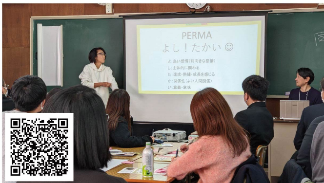
#キャリア教育ワーケーション with #ダム際ワーキング @田辺高校・みなべ町島ノ瀬ダム 2/13 (月)