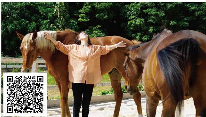
#ホースコーチング体験会 @アドベンチャーワールド 2/15 (水) & 2/16 (木)