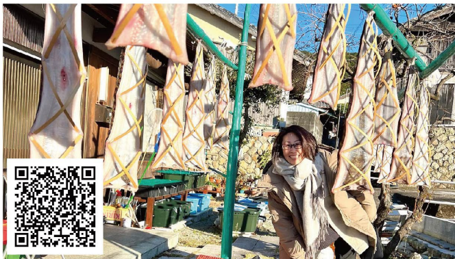
#一次産業ワーケーション - ウツボ漁 @見老津港 (すさみ町) 2/12 (日) - 2/19 (日)