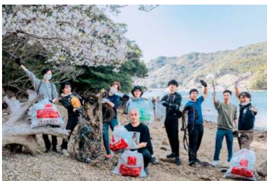
ビーチクリーニング