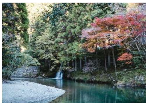
那智勝浦町の太田川