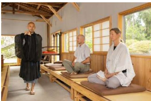
大泰寺での座禅体験