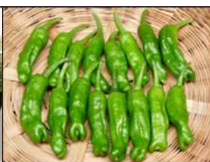
ししわかまる(ししとう)