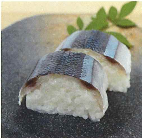
さんま寿司 (腹開き)