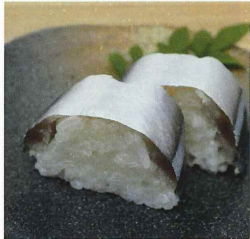
さんま寿司 (背開き)