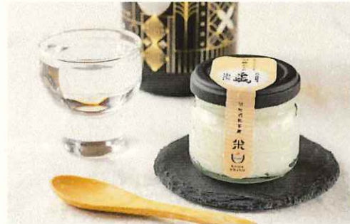
22 車坂酒かすレアチーズケーキ