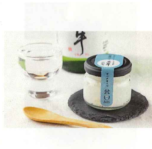
24 黒牛酒かすレアチーズケーキ