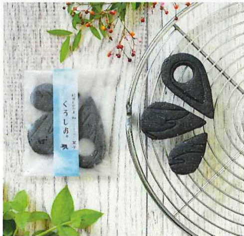
21 紀州わかやま 和-nagomi-菓子 くろしお。