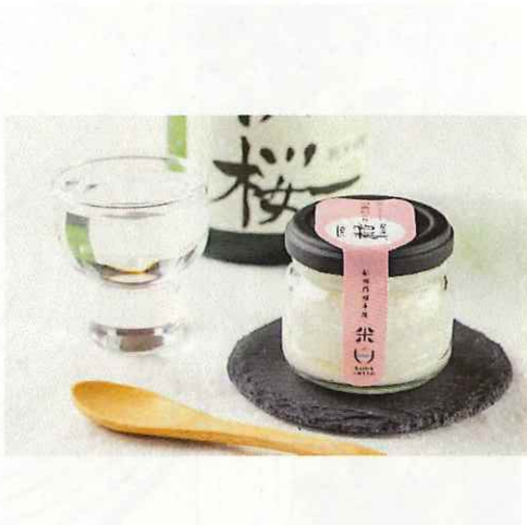
23 初桜酒かすレアチーズケーキ