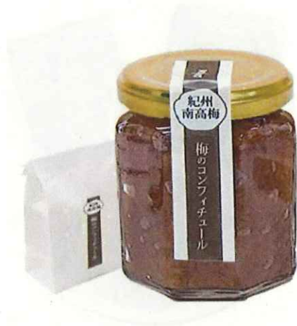
63 南高梅のコンフィチュール