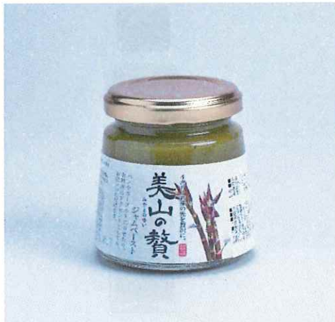
61 美山の贅シリーズ イタドリジャムペースト