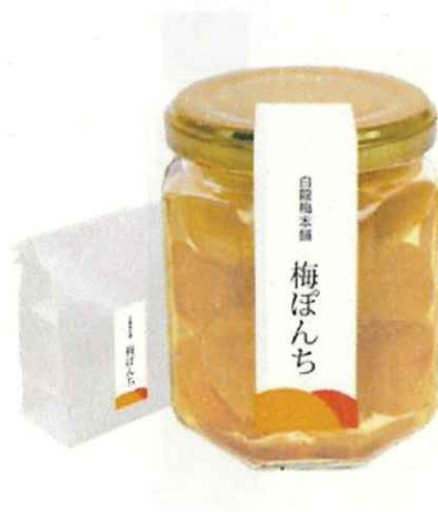
64 青梅シロップ漬 梅ぼんち