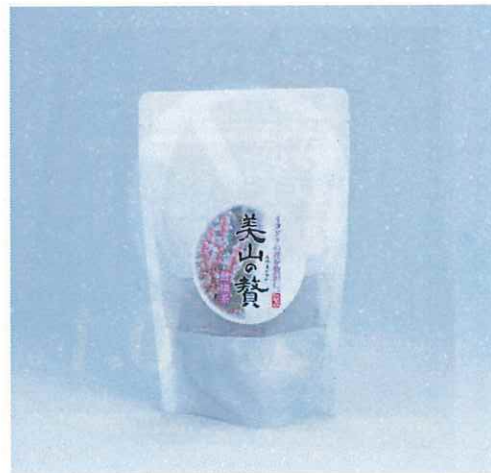
62 美山の贅シリーズ イタドリ健康茶