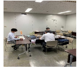
令和4年度マッチング商談会の様子