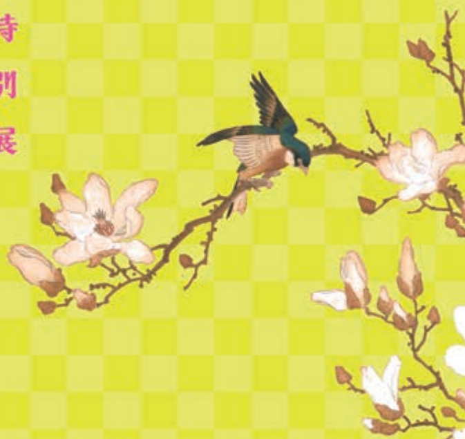
花鳥図 池永柳潭筆 深専寺蔵

むかし、醤油のまち湯浅は、 文学やアートが盛んだった!? 知られざる、その実態に迫る!