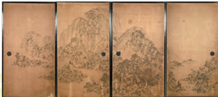
山水図襖 平林無方筆 福蔵寺蔵