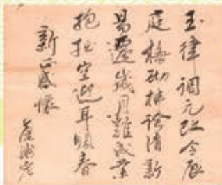
詩書貼交掛幅(部分) 石田葉洲筆 極楽寺蔵