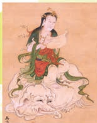
普賢菩薩像 馬上清江筆 個人蔵