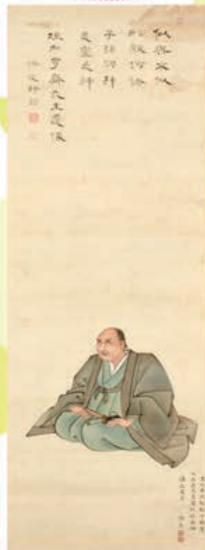
垣内亨斎像 横田汝主筆 菊池海荘賛 安楽寺蔵