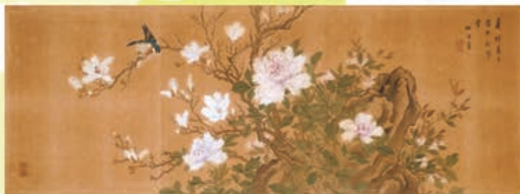
花鳥図 池永柳潭筆 深専寺蔵