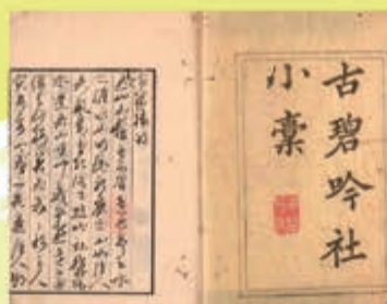
古碧吟社小稿 松原永年編 湯浅町教育委員会蔵