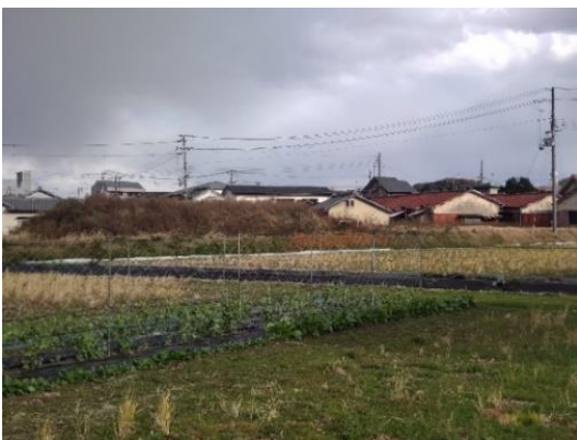
写真1 太田城水攻め堤跡(西から)

①・②の調査の結果、和歌山市出水に所在する堤状遺構は太田城水攻めの際に築かれた堤跡と考えられ、雑賀衆の解体と近世和歌山城下町建設の契機となった重要な戦いの跡を残す遺跡として学術的価値が高いことから、条件の整った南側の盛土遺構を和歌山県指定文化財〔記念物(史跡)〕に指定して保護を図ることとなった。