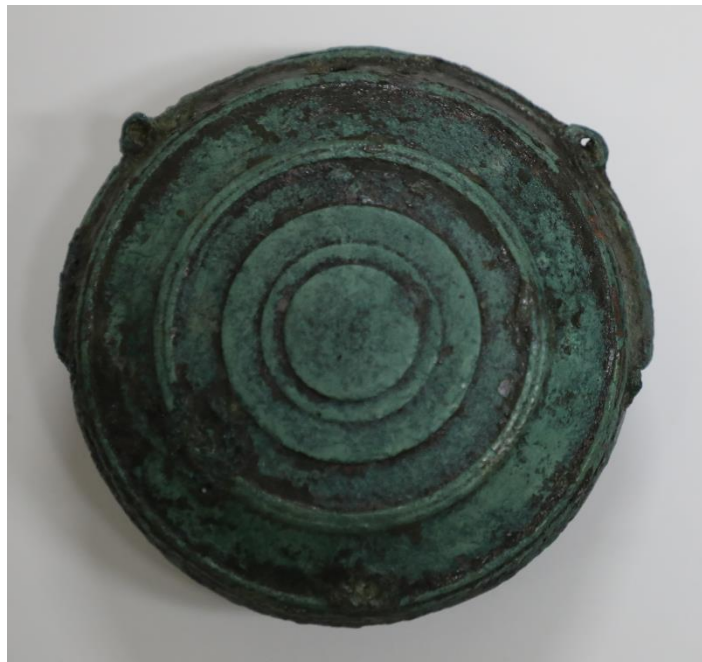
鷺ノ森遺跡出土鱧口

このように鷺ノ森遺跡出土鱧口は、鱧口の変遷を考える上でも重要な資料であり、現存する最古級の作例として学術上の価値が高い。