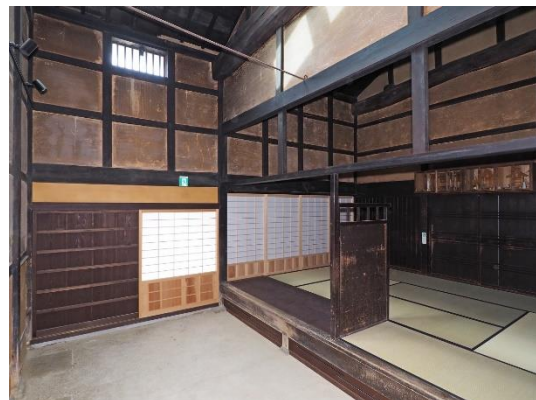
主屋 トオリニワからダイドコロを見る