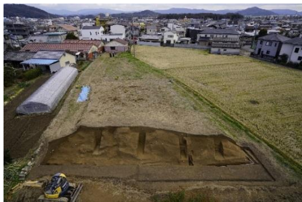
写真2 堤跡の発掘調査状況(北西から)