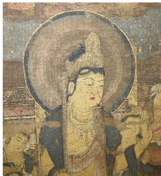
阿弥陀三尊のうち勢至菩薩