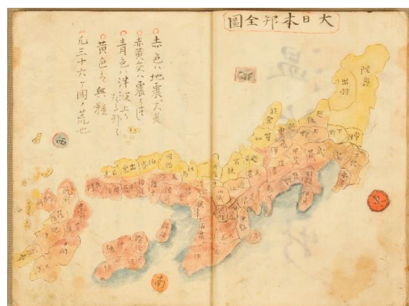
安政聞録 全国の被害状況の図