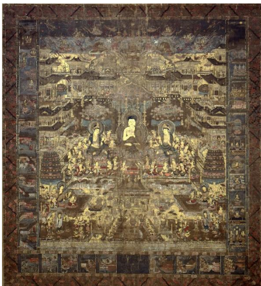
絹本著色当麻曼陀羅図 全図

このように、本作は、県内の西山浄土宗の有力寺院である総持寺に伝来する、14世紀前半に遡る数少ない当麻曼荼羅図のひとつとして価値が高い。