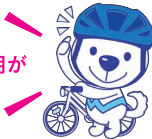
自転車乗車中のヘルメット 着用状況別の致死率 (平成30年～令和4年合計)