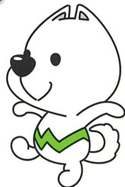
和歌山県PRキャラクター 「きいちゃん」

主催 和歌山県県産品建設資材登録事業者連絡会 【連絡先】 TEL 0736-64-8099