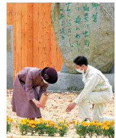
お手入れ行事（写真左：枝打ち、写真右：施肥）