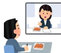
専門家による指導