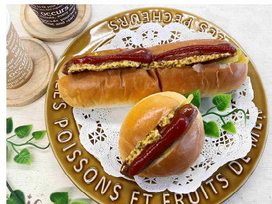
ジビエホットドッグ