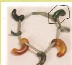
[箕島1号墳(有田市)玉類(実物に1点だけ贋作が混じる)]

骨董的価値を追求して作成されたフェイク(贋作)や見学者の理解促進のために作成されたフェイク(レプリカ)の展示を通じて、その特徴や製作背景を紹介します。