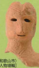
[特別史跡 岩橋千塚古墳群 前山A58号墳(和歌山市) 人物埴輪]

6~7世紀を中心とした岩橋千塚古墳群をはじめとする和歌山地域の群集墳や近畿地方各地で築造された大規模群集墳の出土品を通じて、群集墳が築造された歴史的背景や和歌山地域の特色を紹介します。