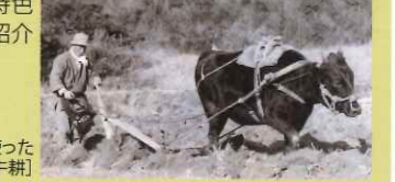
[カラスキを使った牛耕]

和歌山平野でかつて使った牛の農耕具を中心に展示し、紀ノ川下流域における二毛作の歴史と農具の特色について紹介します。