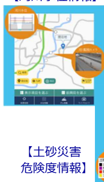
【土砂災害危険度情報】