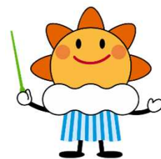
気象庁マスコットキャラクター 「はれるん」