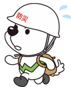
和歌山県マスコットキャラクター 「まいちゃん」