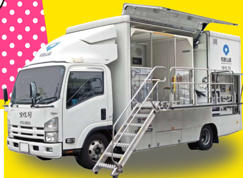
地震体験車「ごりよう君」