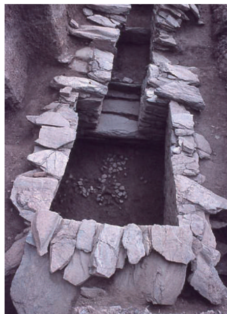
「紀伊風土記の丘ガイドブック 大谷山編」 第 1 期 木村健会員