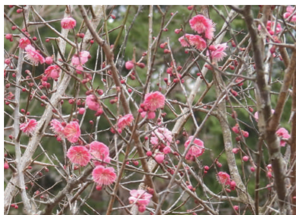
「紀伊風土記の丘の植物」 第 8 期 六川智佐子会員