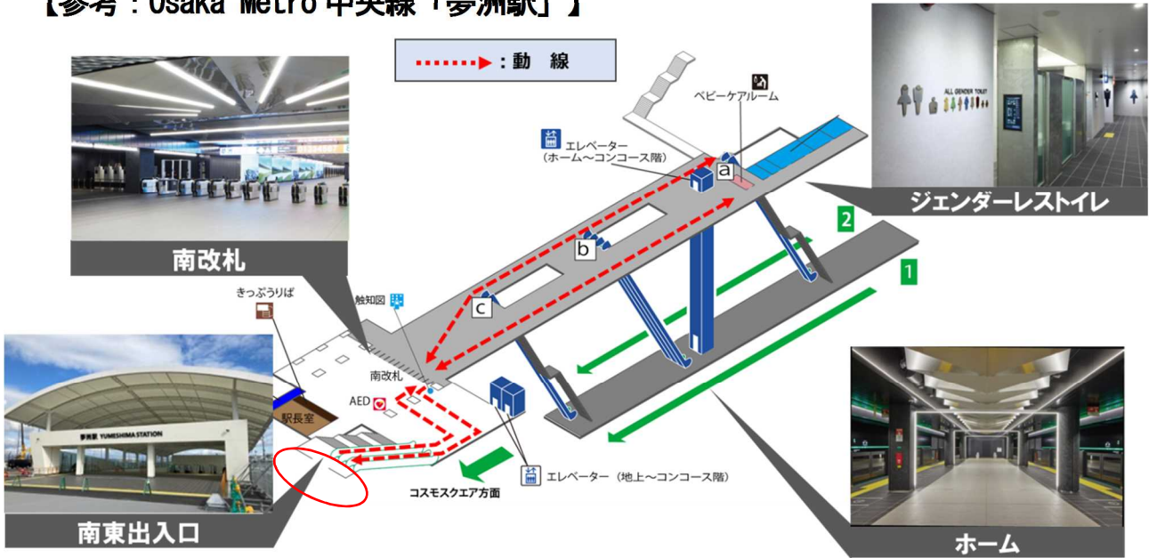
<構内写真①：南改札前広場（構内）から南東出入口（構外）に向けて>