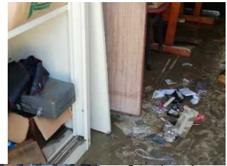
【和歌山市 紀三井寺】