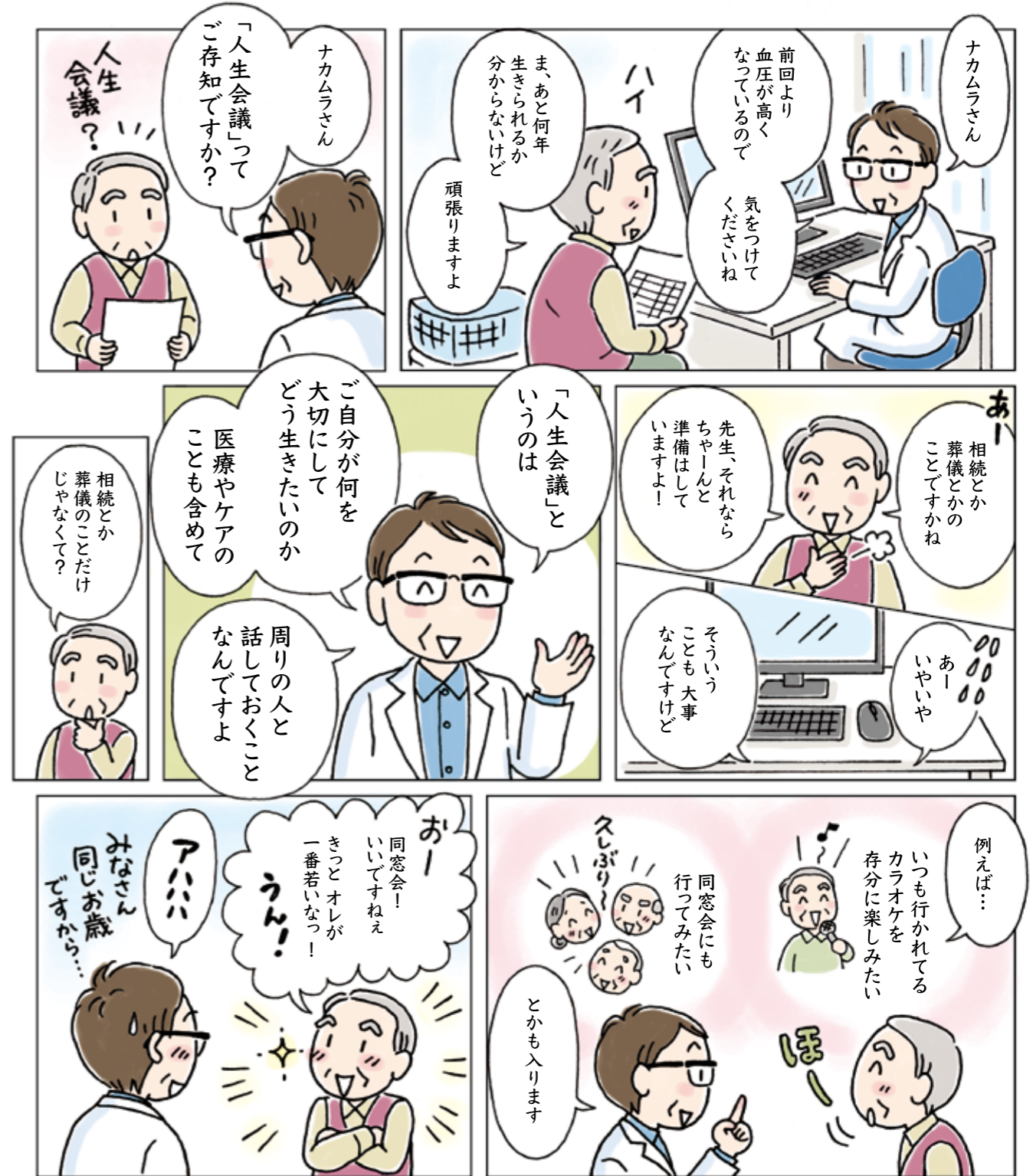
イラスト/漫画: 幡谷智子