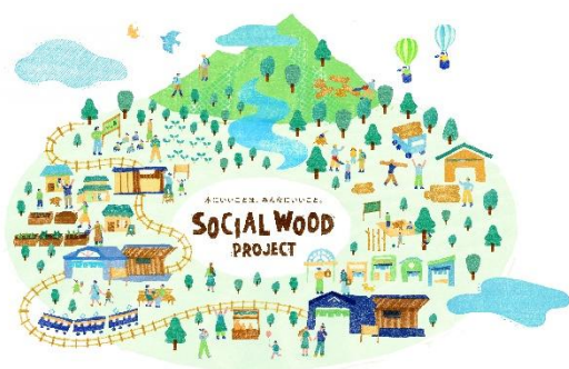
SOCIAL WOOD PROJECT ビジョンマップ