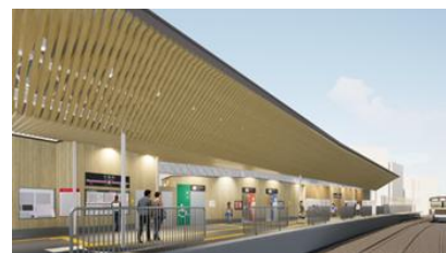
戸越銀座駅(2016年度) 旗の台駅(2019年度) 長原駅(2021年度) 千鳥町駅(2026年秋竣工予定) （「木になるリニューアル」が行われた東急電鉄池上線の各駅）