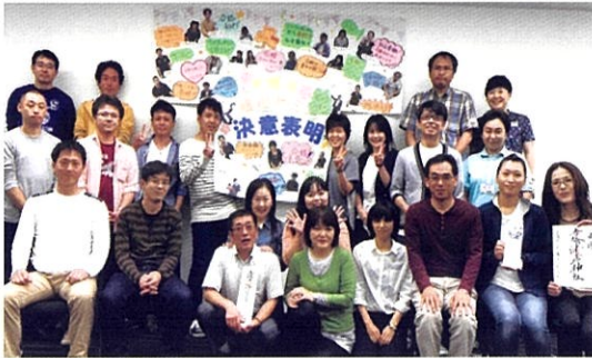
2016年度 面接授業のクラスにて撮影